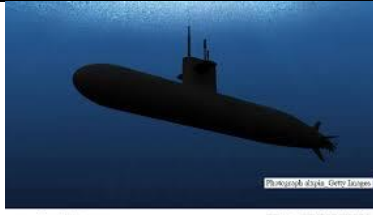
www.BoatFishing.gr ΥΠΟΒΡΥΧΙΟ, υποβρύχιο